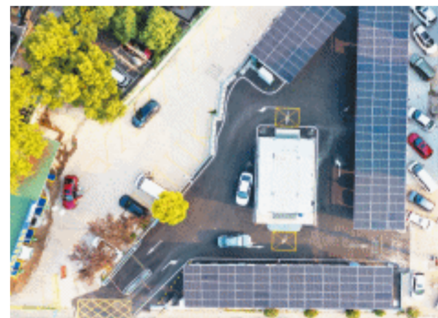
长沙首个“光储充换”绿色能源微电网示范站俯瞰图。

长沙晚报10月10日讯(全媒体记者 吴鑫讯 通讯员 李好)1秒1公里极速快充,1分半钟全程无人化自动换电,光储充换全场景应用样样齐全……10月10日,长沙首个“光储充换”绿色能源微电网示范站在长沙天心区投入使用,给新能源汽车的车主们带来不一样的体验。