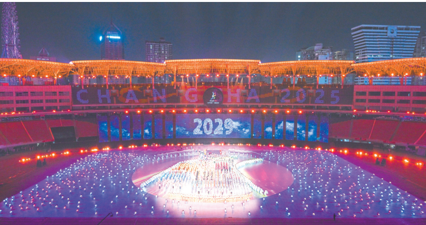
在长沙市第十一届运动会开幕式中，长沙发出“2029全运会”的热情邀约。

时代孕育思想，思想指引航程。2025年10月21日，市委理论学习中心组开展集体学习，深入学习贯彻习近平文化思想以及习近平总书记关于意识形态工作、文化遗产保护传承的重要论述。省委常委、市委书记吴桂英主持并讲话，强调要更好担负起新时代的文化使命，努