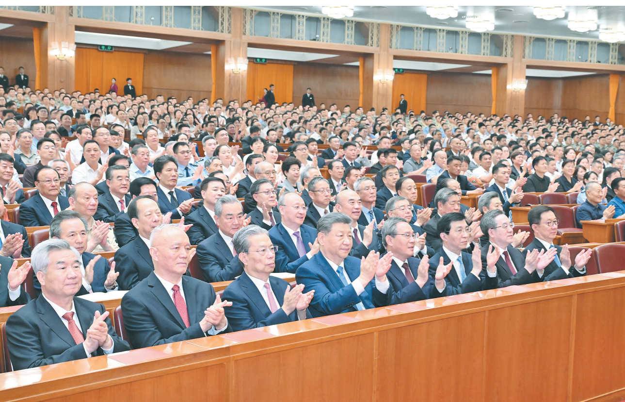
6月29日晚,庆祝中国共产党成立105周年音乐会《人民至上》在北京举行。习近平、李强、赵乐际、王沪宁、蔡奇、丁薛祥、李希、韩正等党和国家领导人,同约3000名观众一起观看演出。

新华社北京6月29日电 深情乐章致敬辉煌历程,嘹亮歌声唱响人民史诗。庆祝中国共产党成立105周年音乐会《人民至上》29日晚在京举行。习近平、李强、赵乐际、王沪宁、蔡奇、丁薛祥、李希、韩正等党和国家领导人,同约3000名观众一起观看演出,共同庆祝这个光辉的节日。 人民大会堂华灯璀璨,洋溢着喜庆的气氛。19时55分,在欢快的乐曲声中,习近平等党和国家领导人来到音乐会现场,全场响起热烈的掌声。 “唱支山歌给党听,我把党来比母亲……”伴着清亮的童声合唱,音乐会拉开帷幕。演出分为五个乐章,文艺工作者们以精湛的演奏、动人的歌声,表达对党的无限热爱,唱响民族复兴的时代强音。 一曲《红旗颂》恢弘奏响,雄浑旋律激荡着赤子情怀,管弦乐《致先辈》抒发对革命先烈的深切缅怀和崇高敬意。《映山红》《八月桂花遍地开》《黄河颂》《解放区的天》《重走长征路》等经典歌曲,诉说中华儿女同心筑梦的美好心声。